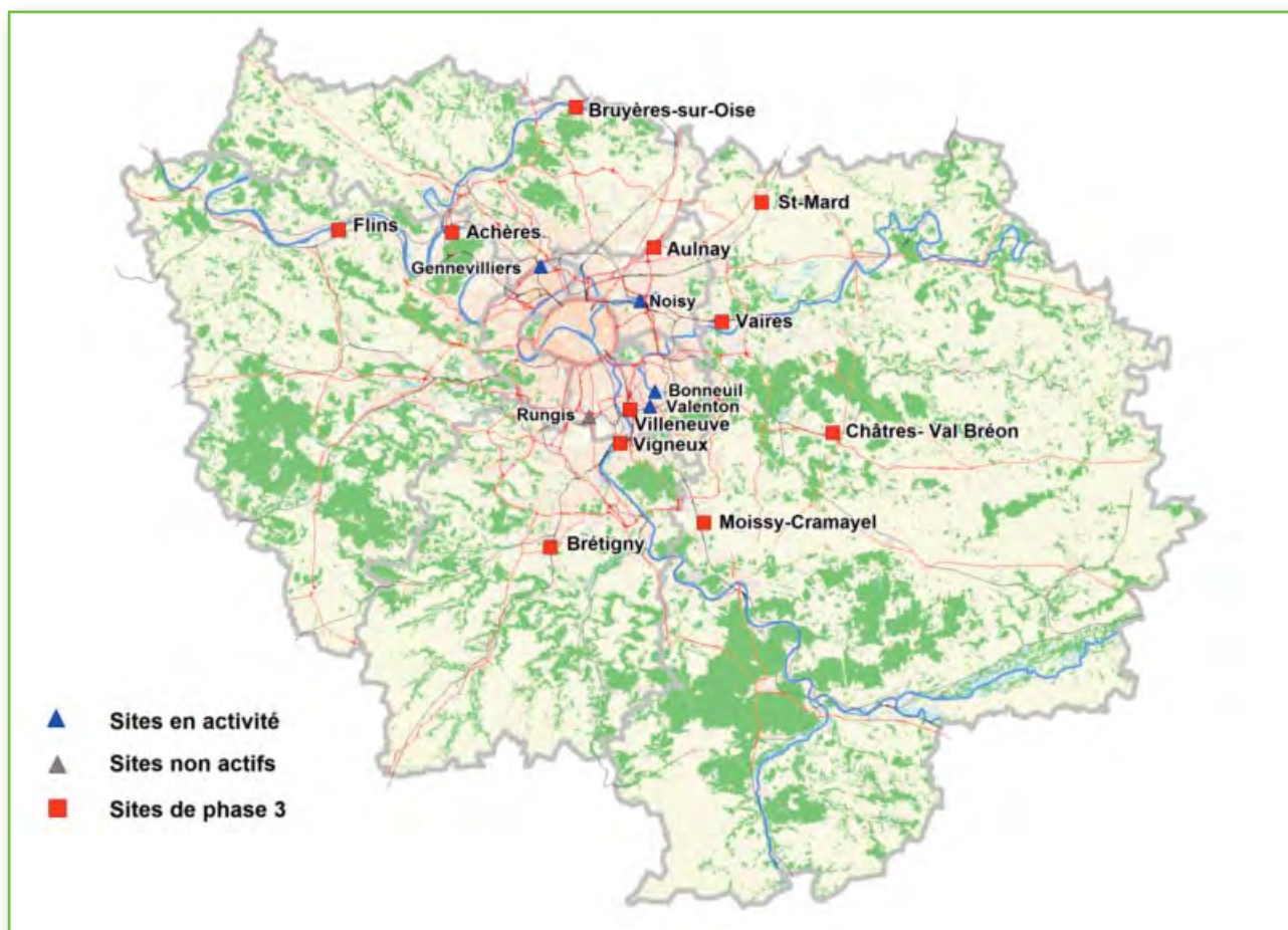
Carte des sites potentiels analysés en phase 3